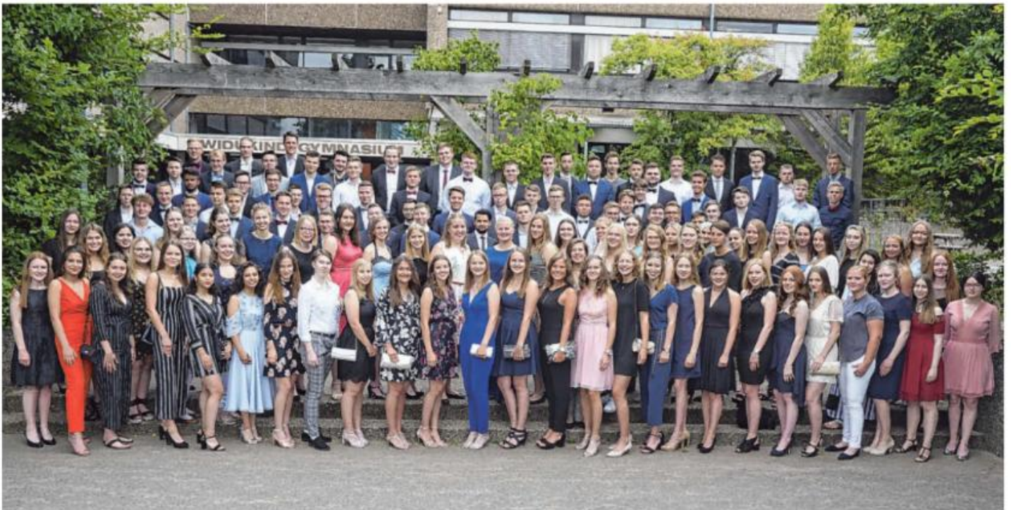
Feierlicher Anlass: Festlich gekleidet nahmen die Abiturientinnen und Abiturienten des Widukind-Gymnasiums Enger (WGE) ihre Zeugnisse entgegen und feierten ihren Abschluss.