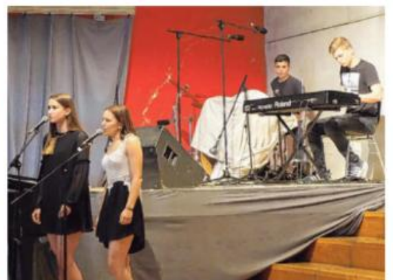
Musikalische Begleitung: Das Jazz-Rock-Ensemble unterhielt das Publikum mit Beatles-Songs.

Aber erstmal wurde gefeiert – mit Musik, Tanz und Show. Das Jazz-Rock-Ensemble sorgte mit zwei Beatles-Songs für die musikalische Begleitung und der Sportkurs der Jahrgangsstufe Q1 lieferte bei der „Oscar-Verleihung“ filmreife Tanzeinlagen ab.