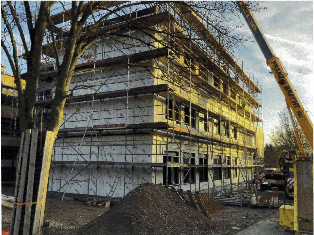
Blick von der Sattelmeierstraße auf den Erweiterungsbau am 16. Dezember 2025

Es ist Zeit, für das, was war, danke zu sagen, damit das, was werden wird, unter einem guten Stern beginnt.